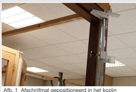
Afb. 1 Afschrijfmal geïnstalleerd in het kozijn

103500 Afschrijfmal renovatie 2005 mm t/m 2205 mm