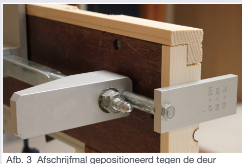
Afb. 3 Afschrijfmal geïnstalleerd tegen de deur