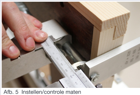
Afb. 5 Instellen/controleren maten