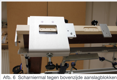
Afb. 6 Scharniermal tegen bovenzijde aanslagblokken