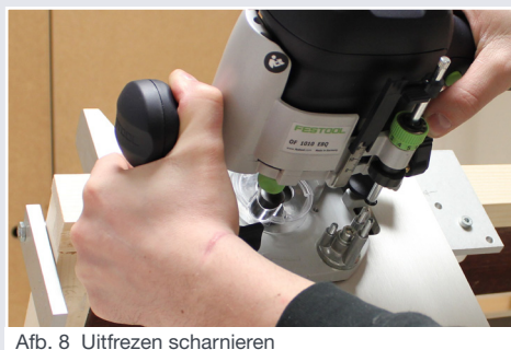
Afb. 8 Uitfrezen scharnieren