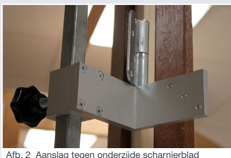
Afb. 2 Aanslag tegen onderzijde scharnierblad