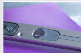
Afb. 1 Deur gesloten