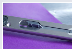
Afb. 2 Deur open