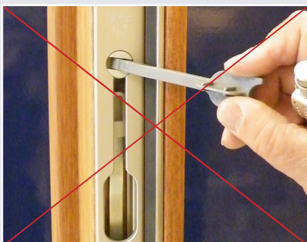
Afb. 6 Foute bediening

De hendel kan ook uit de Multipoint gehaald worden (zie afb. 7 & 8). Dit voorkomt eventuele schade aan de hendel. Schade kan bij een vaste hendel ontstaan doordat bijvoorbeeld de deur bij een harde windvlaag tegen de hendel slaat. Doordat de hendel uitneembaar is, schiet deze los. De hendel kan uiteindelijk weer eenvoudig teruggeplaatst worden.