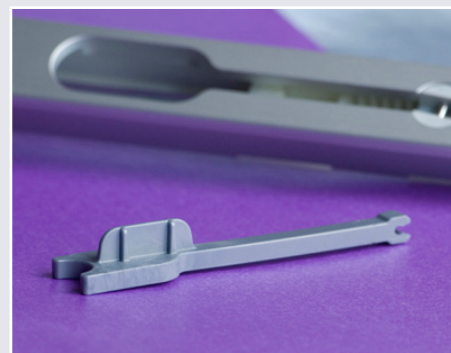
Afb. 8 Hendel uitneembaar