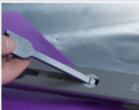
Afb. 3 Hendel omhoog halen