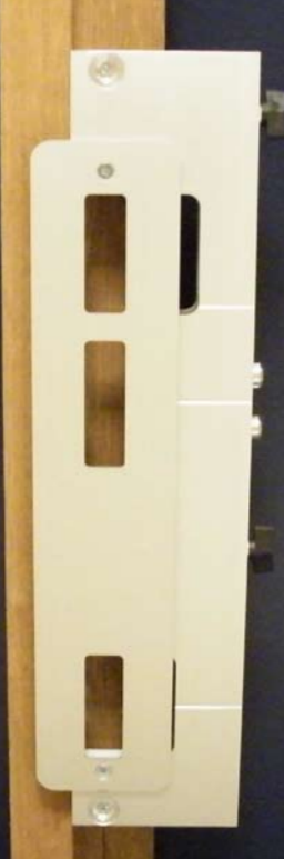
Uitfrezen van de sluitkom