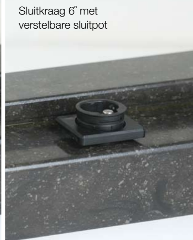
Sluitkraag 6" met verstelbare sluitpot