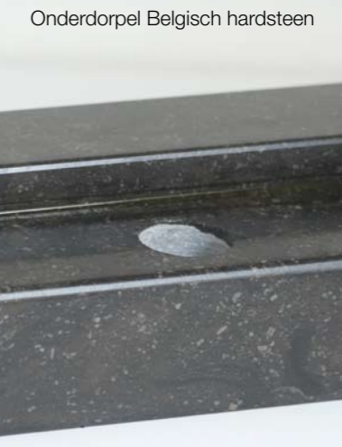
Onderdorpel Belgisch hardsteen

De nieuwe HMB diamantboorset (art. nr.: 106054) bestaat uit producten en hulpstukken die u nodig heeft om een nastelbare sluitpot (art. nr.: 707031) op de juiste maat in te boren. Het product is bestemd voor hardsteen en holonite onderdorpels. De boorset bestaat uit Gardena hulpstukken, waaronder kraanstuk 3/4, waterstop, mini waterspoelknop, steeksleutel 22, steeksleutel 27 en diamantboor 30 mm. Dit alles is verpakt in een praktische koffer.